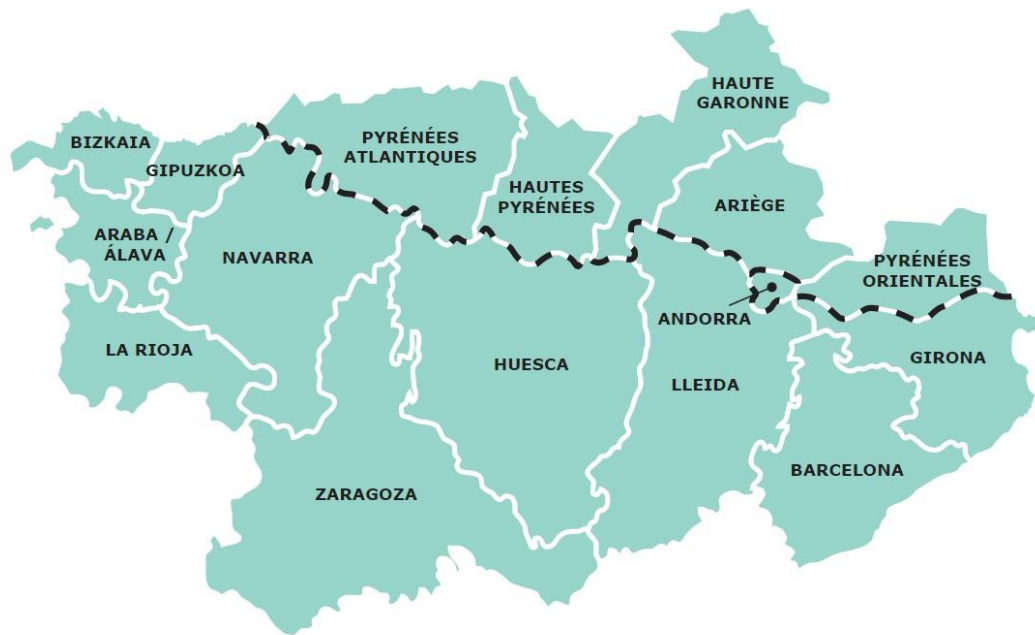
Mapa de la zona del programa